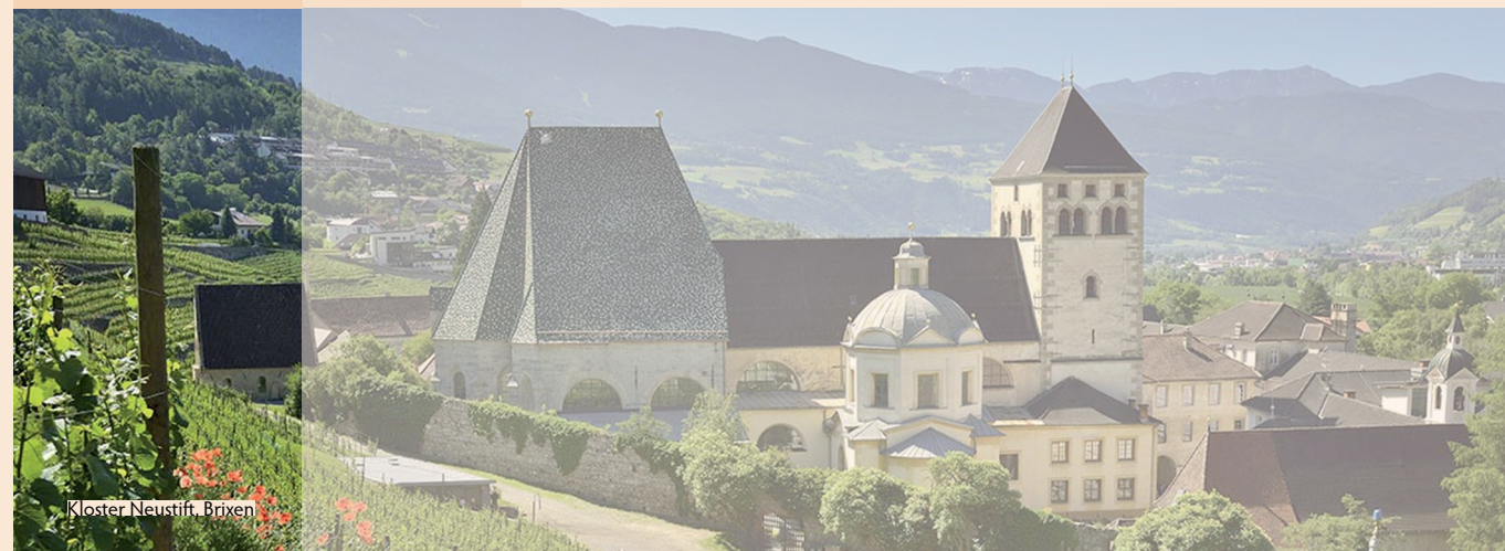
Kloster Neustift, Brixen